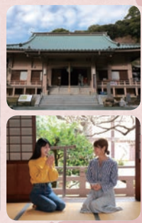
十七世紀に鎮国寺