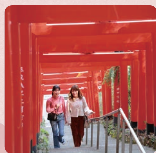
左右ともに成田山不動寺